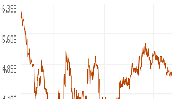
3 Year Chart